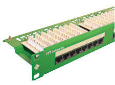
19" Voice Panel 1HE 24xRJ45/u