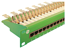
19" Voice Panel 1HE 30xRJ45/s