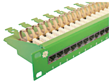
19" Voice Panel 1HE 30xRJ45/u