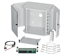
Kit de montage apparent