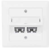
EDIZIOdue FMI 30° Auslass, 88x88 mm