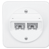
Standard PMI 30° Auslass, Ø58 mm