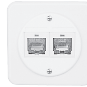
Standard PMI Ø58 mm