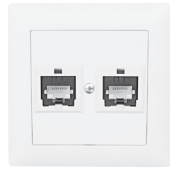
EDIZIOdue FMI 88x88 mm