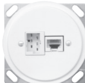
Standard IK Ø58 mm