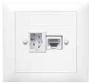
EDIZIOdue FKE 86x80 mm