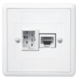
EDIZIOdue FX39 79x79 mm