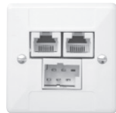
Standard 60x60 mm