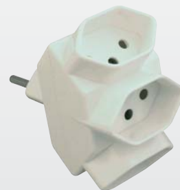
1500: Abzweigstecker T13, angewinkelt, mit Kinderschutz / Fiche de dérivation T13, coudée, avec protection enfant 3x L+N+PE