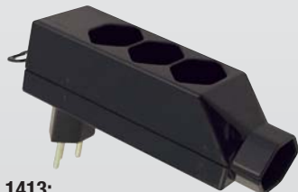
1413: Abzweigstecker T13, drehbar / Fiche de dérivation T13, pivotante 3x T13 horizontal + 1 x T13 vertikal für permanenten Anschluss / 3x T13 horizontale + 1 x T13 verticale pour le branchement permanent