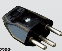
2299: Stecker T12 bis Kabel 8 mm / Fiches T12 jusqu'au câble de 8 mm L+N+PE