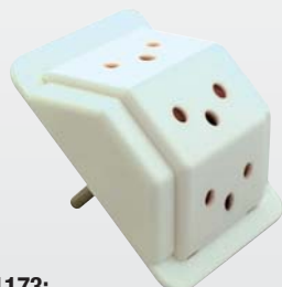
1173: Abzweigstecker T12, Flachauflage, mit Kinderschutz / Fiche de dérivation T12, pos. apparente, avec protection enfant 3x L+N+PE