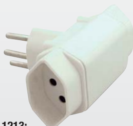
1213: Abzweigstecker T13, extraflach, mit Kinderschutz / Fiche de dérivation T13, extra plate, avec protection enfant 2x L+N+PE