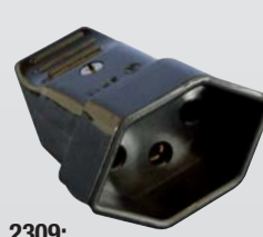
2309: Kupplungen T13 / Prolongateurs T13 L+N+PE