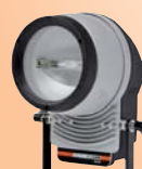
ELBROLIGHT EAL150 150 W = 2500 W puissance lumineuse halogène