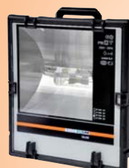
ELBROLIGHT EAL250 250 W = 4000 W puissance lumineuse halogène